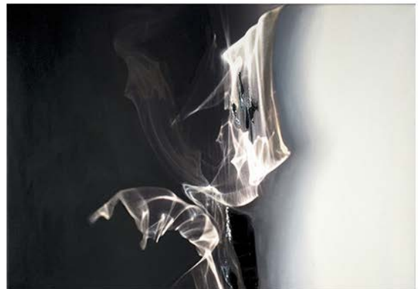
Cordula Hesselbarth: Lichtfiguren (2015–2017).