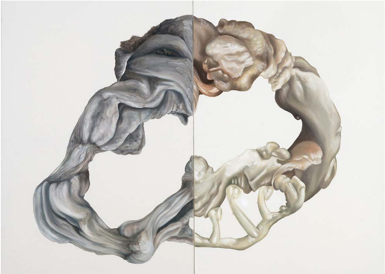
Cordula Hesselbarth: Biomasse-Ring (2006).