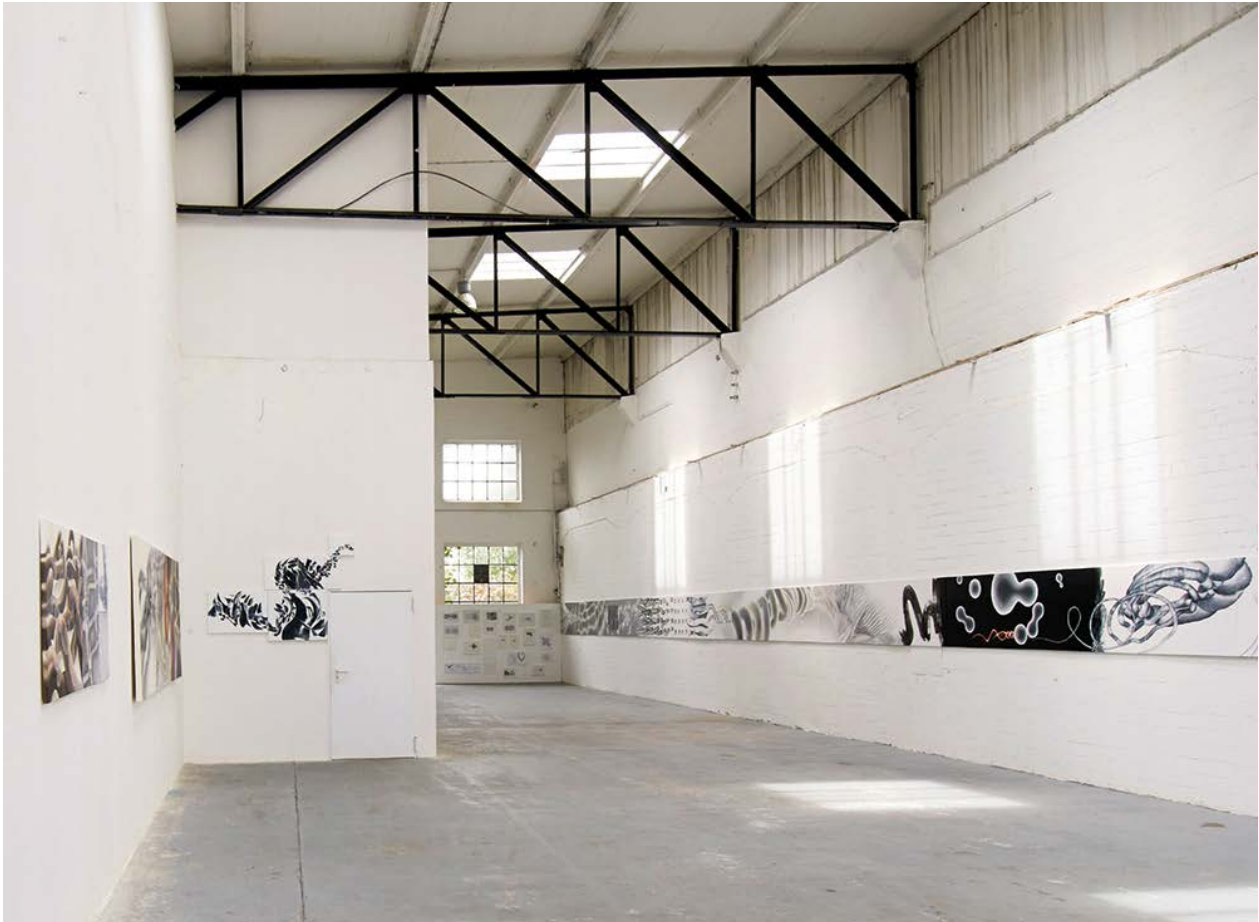
Cordula Hesselbarth: Kontinuum (2012/13). Ausstellungsansicht.

Ich möchte am Beispiel meines Werkes Kontinuum darlegen, was mich künstlerisch bewegt. Es ist ein Bild von 30 Metern Länge, zusammengesetzt aus 34 einzelnen Keilrahmen, das ich in den Jahren 2012–2013 für die Ausstellungshalle am Hawerkamp in Münster entwickelt habe.