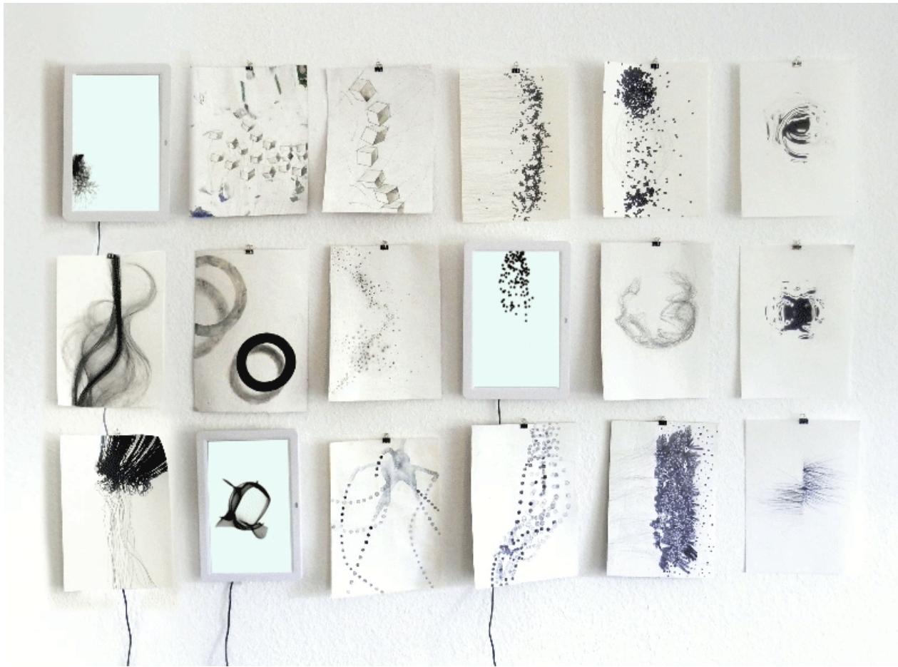
Cordula Hesselbarth: Lebende Zeichnungen (2017).

Die Motive auf den Zeichnungen sind jeweils aus einer Bewegung herausgegriffen, so etwa das Fallen von Kuben, rotierende Punktwolken oder wachsende Verästelungen. Die reine Abbildung auf Papier reichte mir hier nicht mehr aus, um auszudrücken, was ich zeigen wollte. Die Animation auf dem Bildschirm ergänzt die Momente vor und nach dem auf der Zeichnung festgehaltenen Status und verdeutlicht, dass es sich hier um einen Übergangszustand innerhalb eines Prozesses handelt.