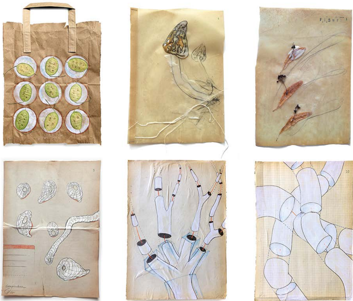
Cordula Hesselbarth: Herbarien und Bildnotizen (2017).